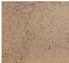
Mainsand 0 bis 2

Die Bilder sind beispielhafte Darstellungen und können je nach Sorte, Charge, Feuchtigkeit und Lichtverhältnissen abweichen.