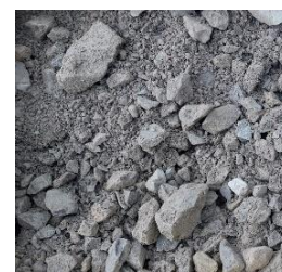
Frostschutz 0 bis 32 güteüberwacht