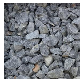
Basalt 16 bis 32