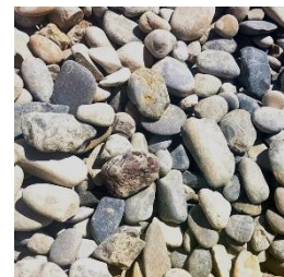
Rundkies 16 bis 32