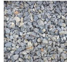
Schotter 8 bis 16