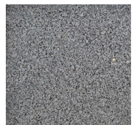
Brechsand 0 bis 2