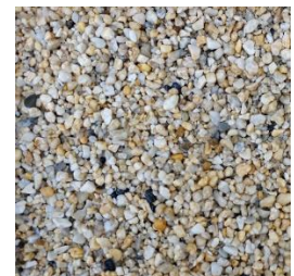
Edelkies 2 bis 8