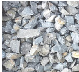
Schotter 2 bis 32