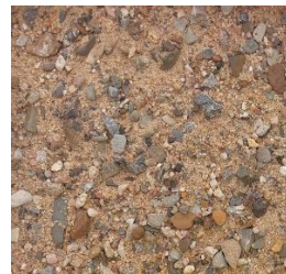
Mainkies 0 bis 16