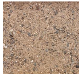
Mainkies 0 bis 8