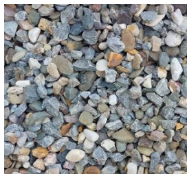
Mainkies 8 bis 16