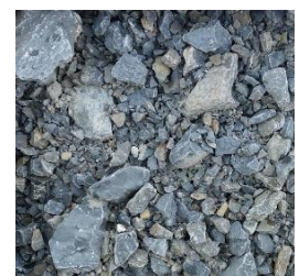
Frostschutz 0 bis 56 güteüberwacht

https://www.lzr.de/produkte-leistungen/sand-kies-schotter/schuetngueter-bilder/