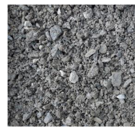
Mineralgemisch 0 bis 16 nicht güteüberwacht