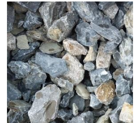
Schotter 32 bis 56