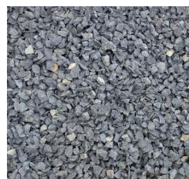
Basalt 2 bis 8