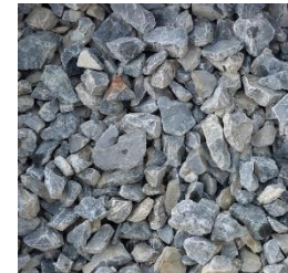
Schotter 16 bis 32