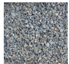
Splitt 2 bis 8