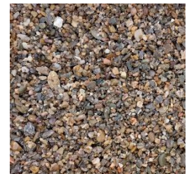
Mainkies 2 bis 8